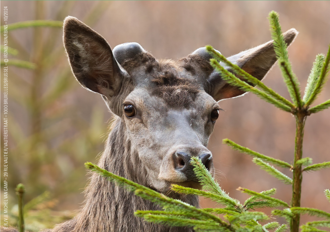
E. RAU, MICHEL VAN CAMP - 29 RUE VAUTIER/VAUTIERSTRAAT - 1000 BRUXELLES/BRUSSEL - © IRSNB/KBINRBINS - 10/2024